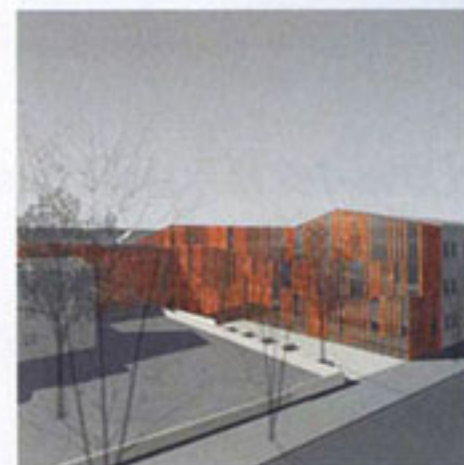
perspektywa od strony ul. Szujskiego