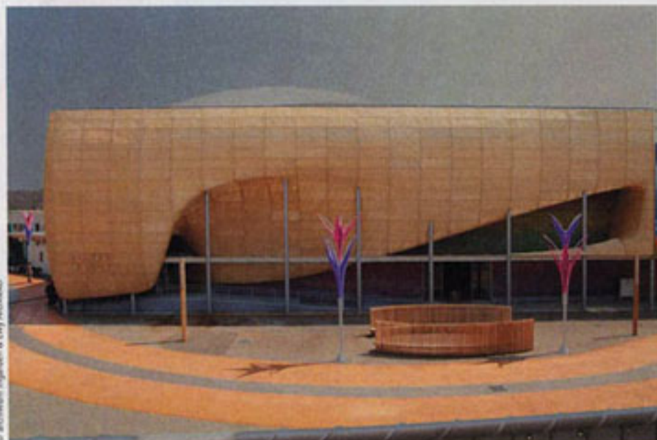
© archiwum Ingarden & Ewý Architekci

GENERALNI WYKONAWCY: Holtmann Messe + Event, GmbH Germany oraz Zakład Budowy i Dekoracji Wrocław