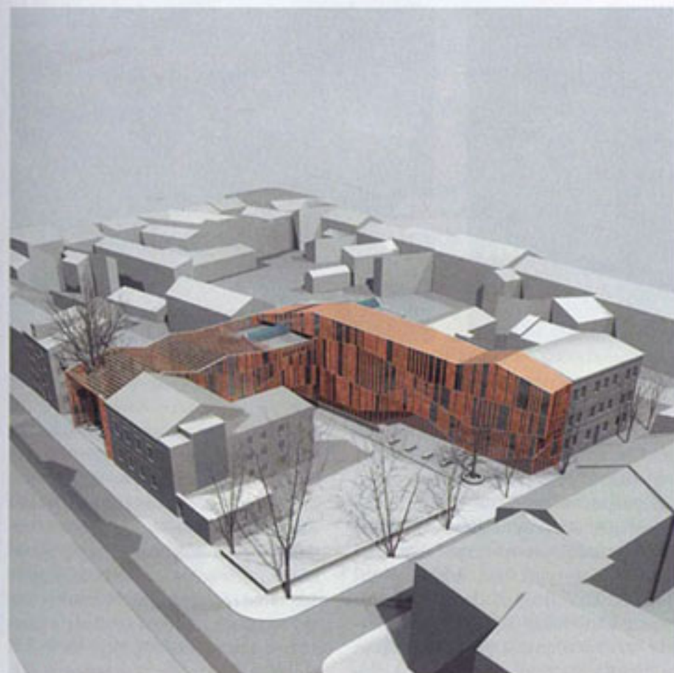
aksonometria — widok od strony ul. Rajskiej i ul. Szujskiego