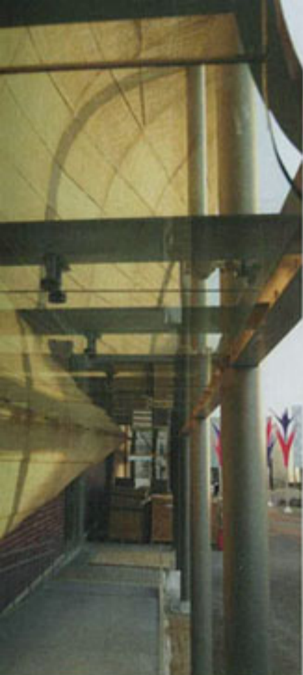
© archiwum Ingriden &amp; Ewy Architekti