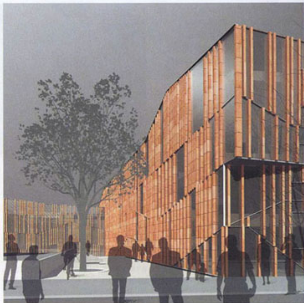
widok od strony ul. Szujskiego